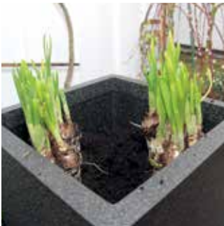
Nytt lager med jord därefter tidiga lökar.