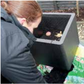
Lökväxter som kommer lite senare på säsongen.