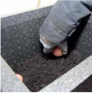
Fyll upp krukans till knappt hälften med jord.