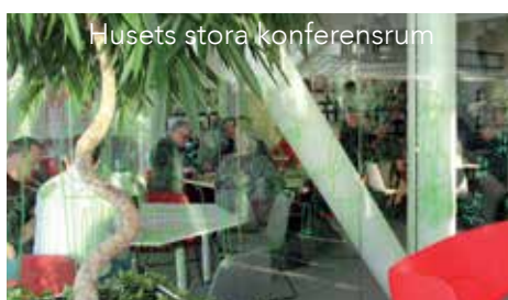
Husets stora konferensrum