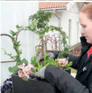
Överst perenner eller som här en ettårig färggrann primula. Metallbågen med murgröna skapar höjd i arrangemanget.