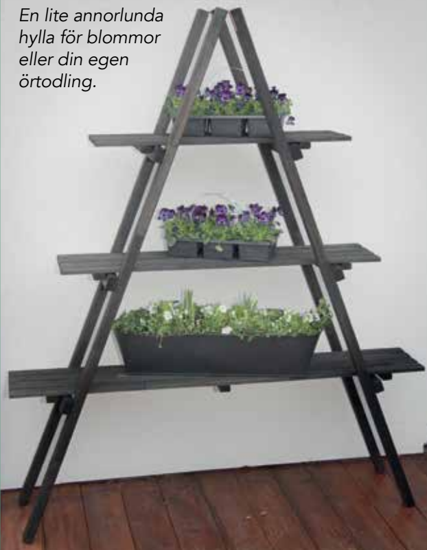
En lite annorlunda hylla för blommor eller din egen örtodling.

Se efter så att inga växter krokar på väg upp