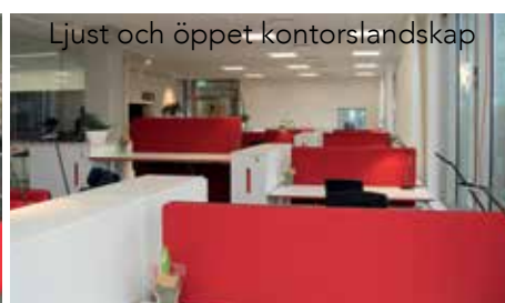
Ljust och öppet kontorslandskap