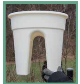
En kruka som gör det möjligt att ha balkonglådan delvis på utsidan.