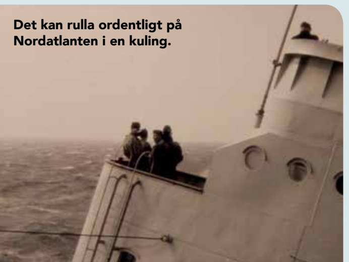
Det kan rulla ordentligt på Nordatlanten i en kuling.

Det gäller att ha ordentliga sjöben om man ska segla ut på de stora världshaven!