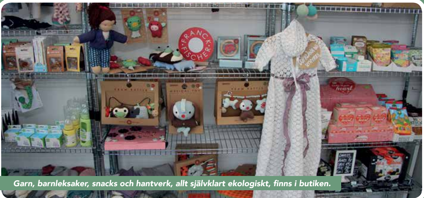
Garn, barnleksaker, snacks och hantverk, allt självklart ekologiskt, finns i butiken.