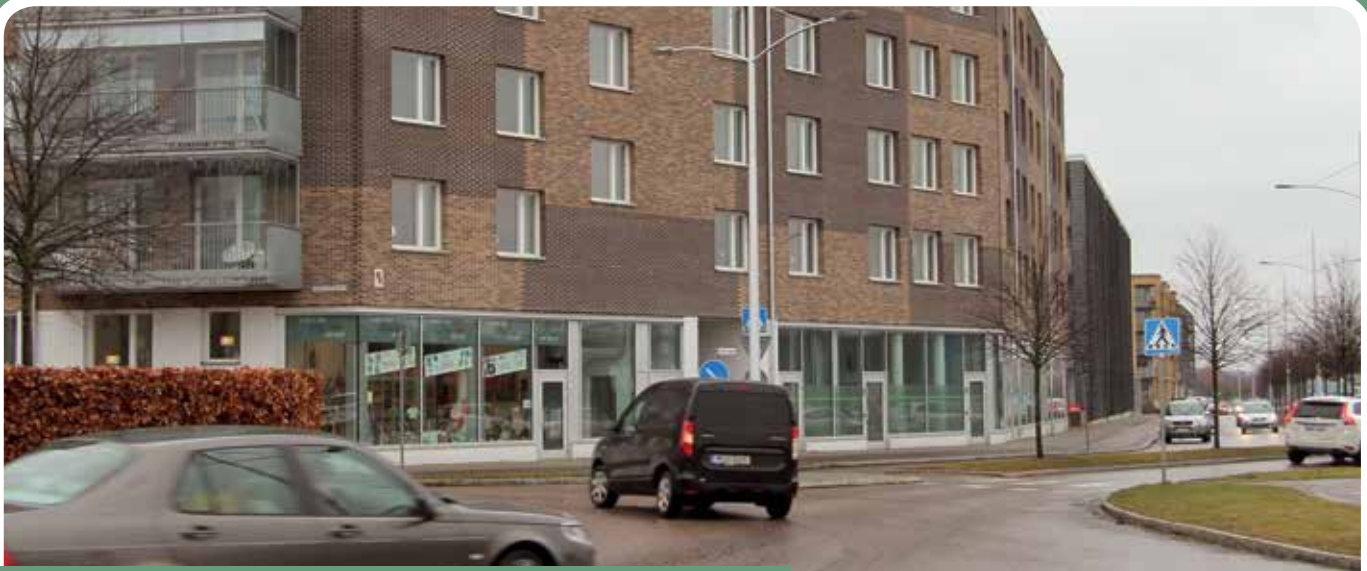
Ett utmärkt läge på Kullagatan precis bakom polishuset.