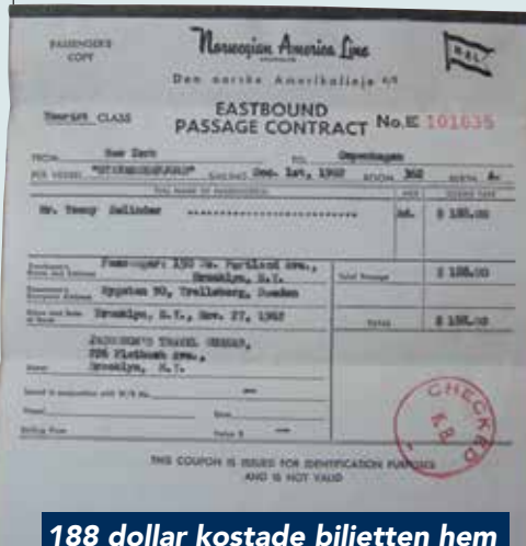
188 dollar kostade biljetten hem