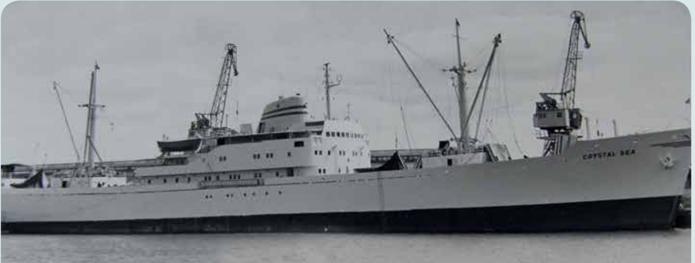
Det var här allt började, ombord på MS Crystal Sea

– När två av mina kompisar 1960 mönstrade på en Malmrosbåt så bestämde jag mig för att också ge sjölivet en chans. Jag åkte in till Malmö, fick mitt läkarintyg och min sjömansbok och sen var det min tur att mönstra på. Det blev en riktigt fin start.