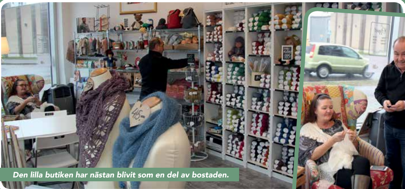
Den lilla butiken har nästan blivit som en del av bostaden.