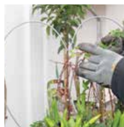
Överst perenner eller som här en ettårig färggrann primula. Metallbågen med murgröna skapar höjd i arrangemanget.