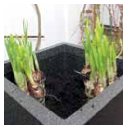
Nytt lager med jord därefter tidiga lökar.