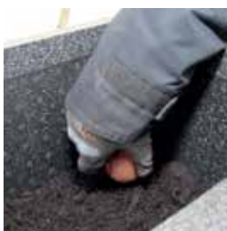
Fyll upp krukorna till knappt hälften med jord.