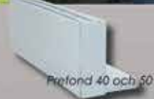
Prefond 40 och 50