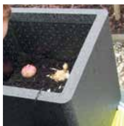
Lökväxter som kommer lite senare på säsongen.