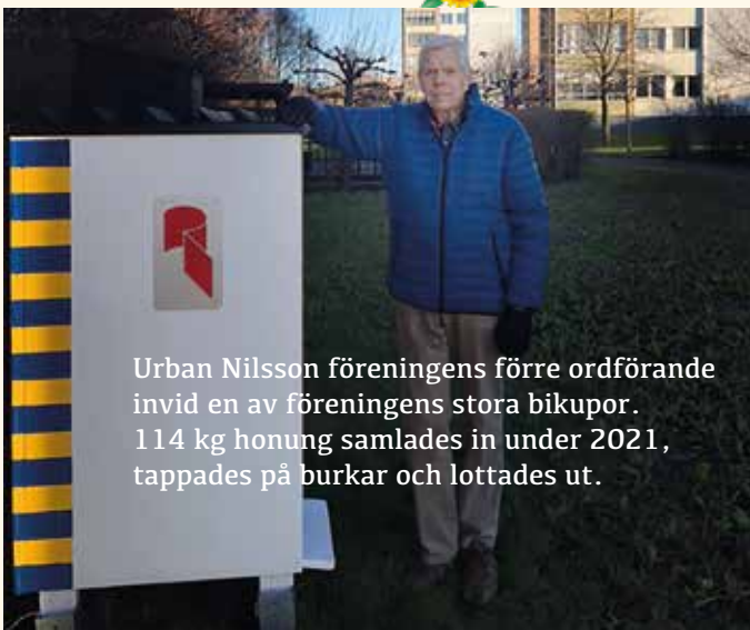
Urban Nilsson föreningens förre ordförande invid en av föreningens stora bikupor. 114 kg honung samlades in under 2021, tappades på burkar och lottades ut.