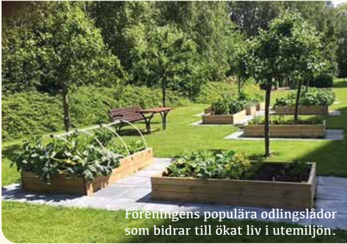
Föreningens populära odlingslådor som bidrar till ökat liv i utemiljön.