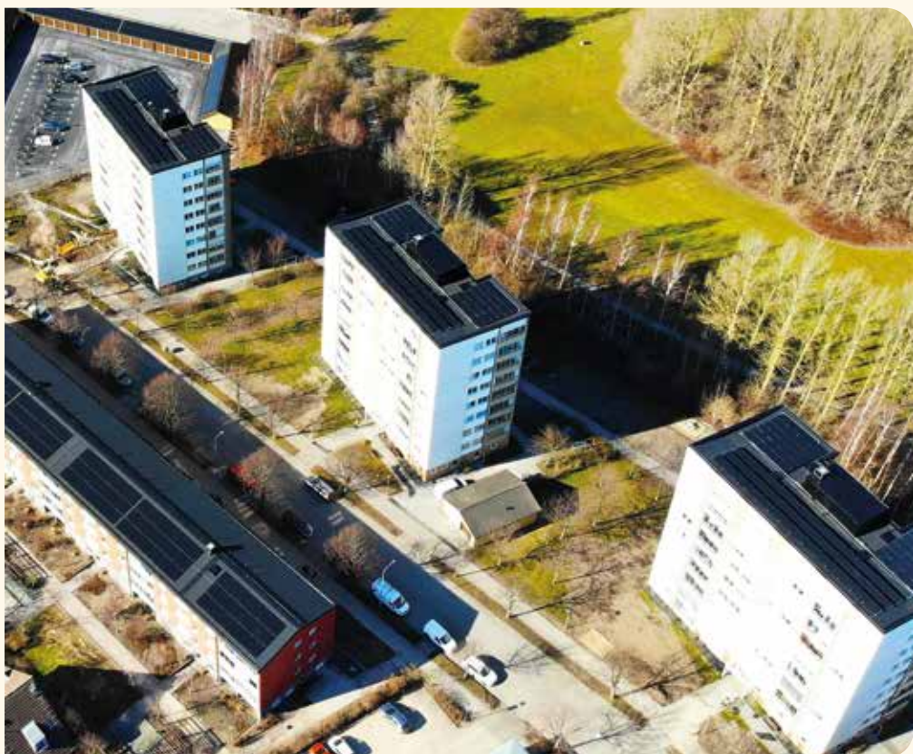
Brf Trelleborgshus 1 består av fyra bostadshus med 136 lägenheter och fyra garage och miljöhus. Föreningen bildades 1962 och byggnaderna är uppförda 1962 -1964.

– Ungefär en miljon lägenheter i Sverige är bostadsrätter. Det finns en enorm potential i att göra beståndet mer hållbart. Stort grattis till Brf Trelleborgshus 1 som gjort ett fantastiskt arbete!