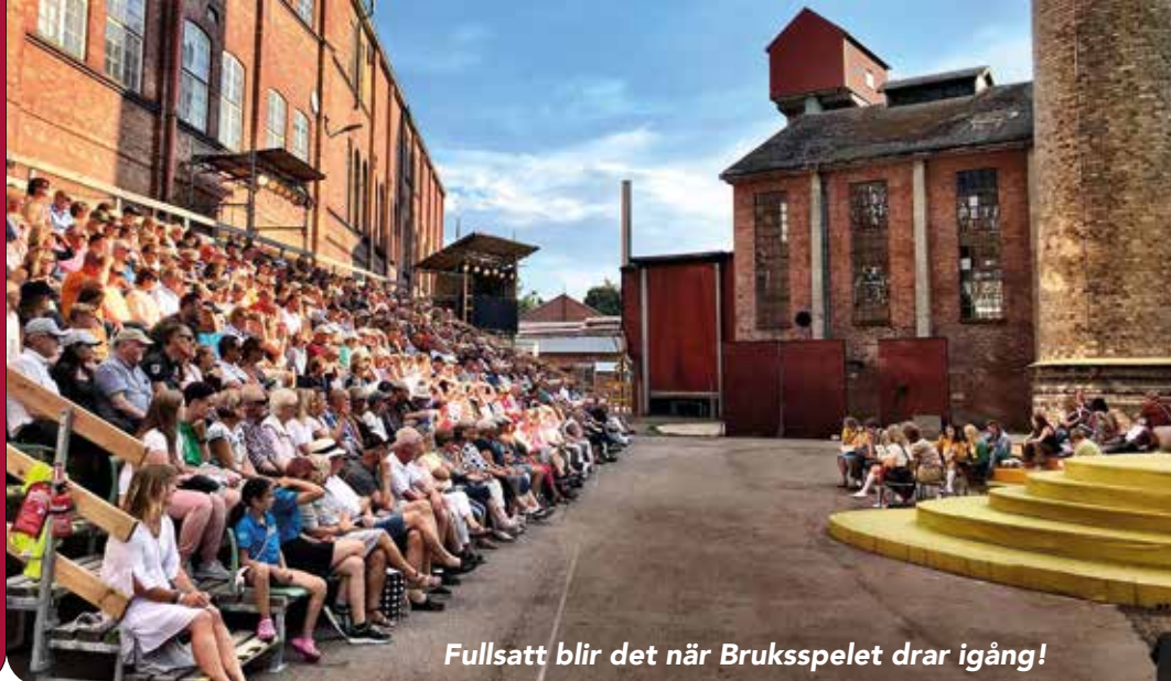
Fullsatt blir det när Bruksspelet drar igång!

För 10 år sedan började de första idéerna att ta form om att skapa en utomhusscen på bruket. Med anor från 1573 är Klippans Bruk Sveriges äldsta papperbruk.