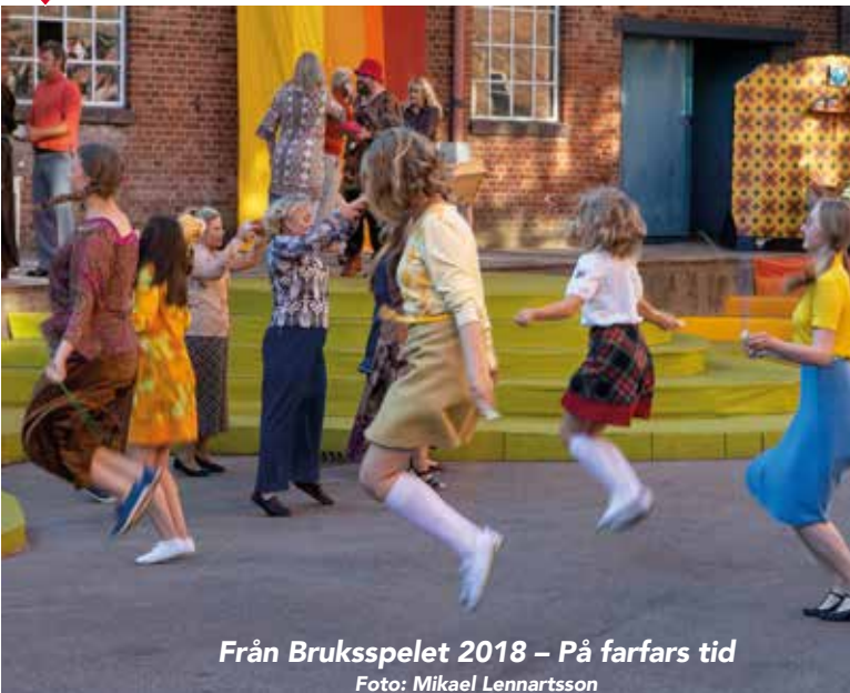
Från Bruksspelet 2018 – På farfars tid