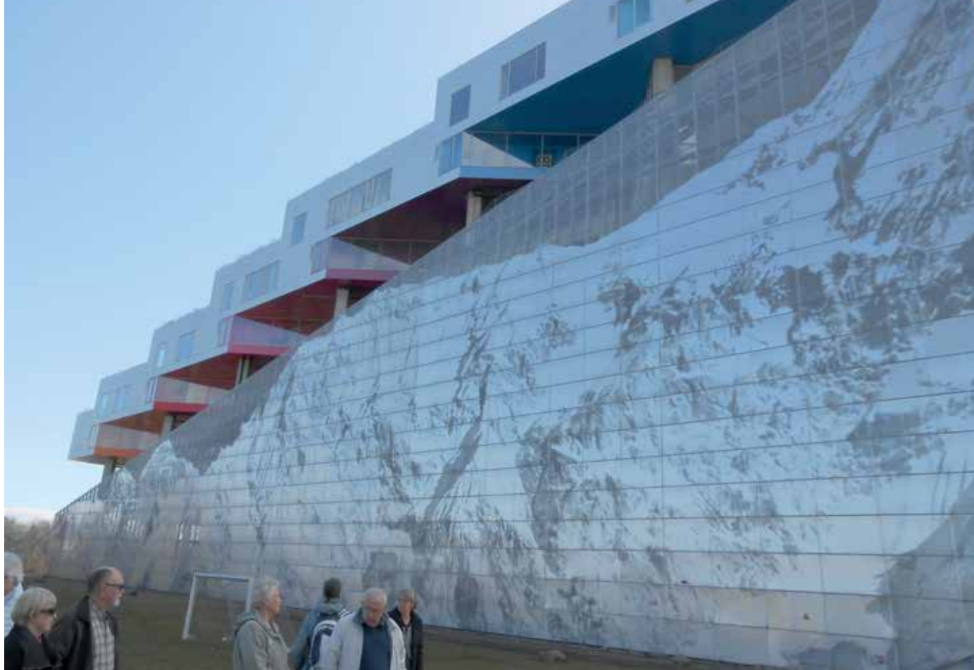
"Bjerget" en byggnad som ska kombinera det bästa av världarna från lägenhet och kedjehus. Och med världens största foto "Mount Everest" som en fondvägg.