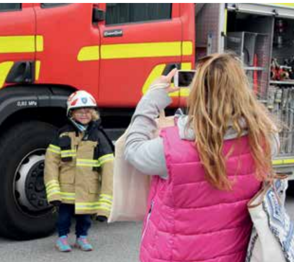
Enzon fick prova brandmannautrustningen. Men det är nog ändå bonde han vill bli!

VINNARNA I DE OLIKA TÄVLINGARNA KONTAKTAS PERSONLIGEN!