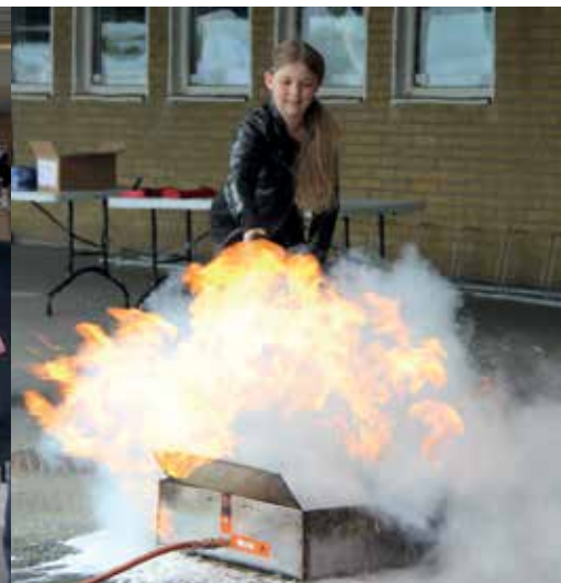
Eowyn från Husie i Malmö provade att släcka med brandsläckare.