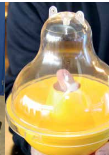
För många getingar? Det finns lösningar!