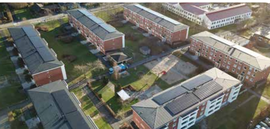
Riksbyggen Brf Högalid i Trelleborg

Fler än sex av 10 bostadsrättsföreningar skulle genomföra någon grön åtgärd om ett statligt stöd införs, visar en undersökning som Riksbyggen gjort. Riksbyggen efterlyser ett statligt stödpaket till bostadsrättsföreningar som är enkelt att använda, som ROT-avdraget.