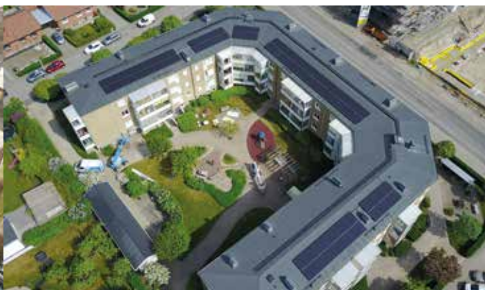
Riksbyggen Brf Tornväktaren IV i Ystad