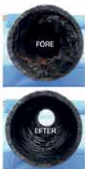
Bilden avser rör som är fräst