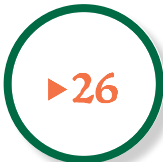
Sidhänvisning! "Texten fortsätter .."