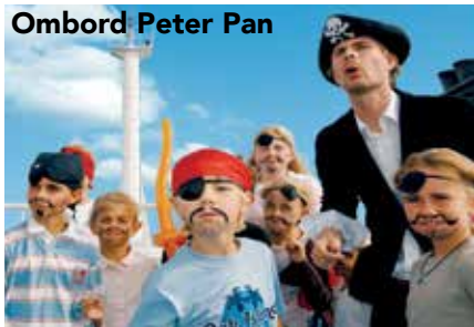
Ombord Peter Pan

Trelleborg har under mer än 120 år varit en viktig länk mot kontinenten. Under en period gick det fyra järnvägsbanor från stan och hamnen började att byggas ut. År 1897 startade postångartrafiken mellan Trelleborg och Sassnitz och 1909 togs den första tåg färjan i trafik. Den 28 mars 1962 börjar TT-line trafikera rutten Trelleborg-Travemünde med bil & passagerarfartyget Nils Holgersson. Under första året transporterades 68.268 passagerare och 541 långtradar!