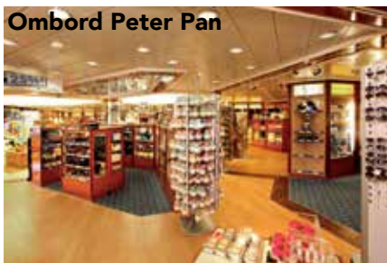
Ombord Peter Pan