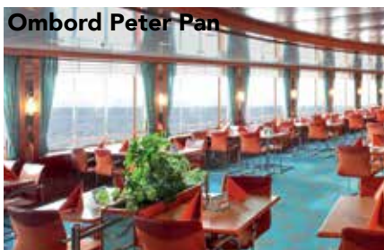
Ombord Peter Pan