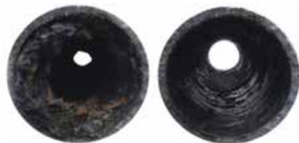
VI SNACKAR INTE SKIT...