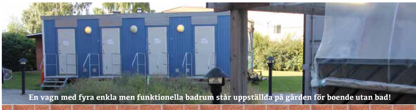
En vagn med fyra enkla men funktionella badrum står uppställda på gården för boende utan bad!

– Jag måste berömma byggarna som visade stor respekt för oss som bodde kvar och försökte anpassa arbetet därefter.