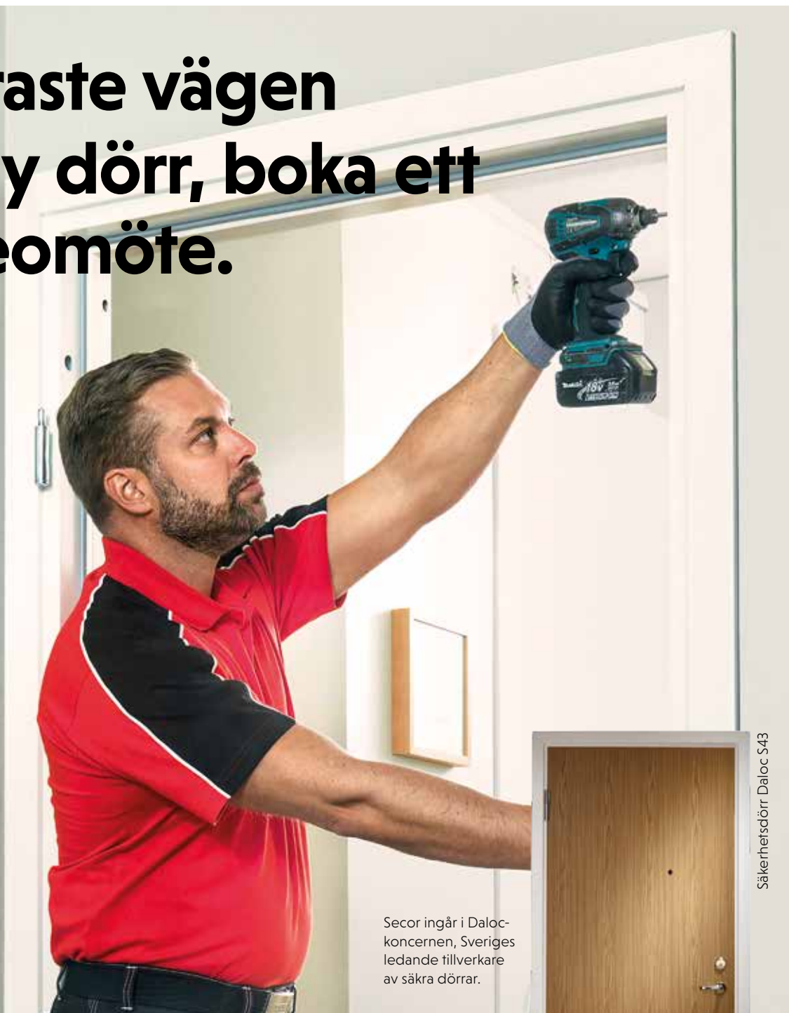
Säkerhetsdörr Daloc S43

Secor ingår i Daloc-koncernen, Sveriges ledande tillverkare av säkra dörrar.