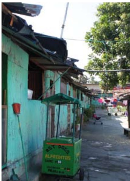
Den gamla bebyggelsen i Centro Histórico i San Salvador.