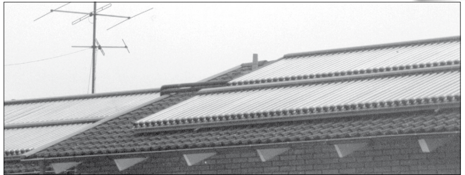
100.000 kronor per år räknar föreningen med att spara på uppvärmningskostnaden.

Det senaste energibesparande tillskottet är 114 kvadratmeter solfångare som nu hjälper till att värma föreningens kranvatten.