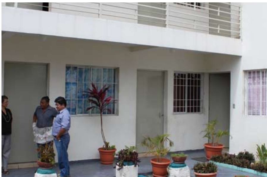
Bild från ett av de kooperativ som fått nya hus.

Att en bra bostad är viktig för både hälsa och välbefinnande är vi nog alla överens om. För oss är det mest en självklarhet.