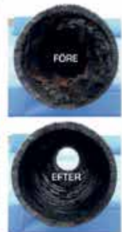
Bilden avser rör som är fräst