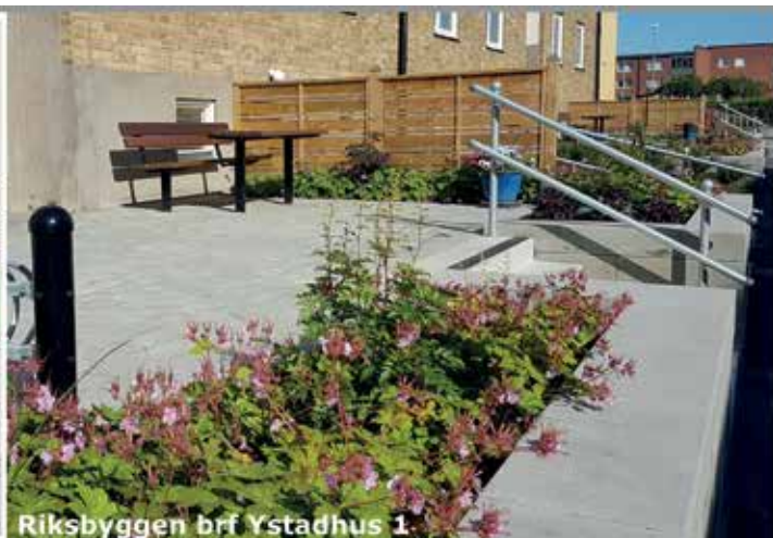
Riksbyggen brf Ystadhus 1